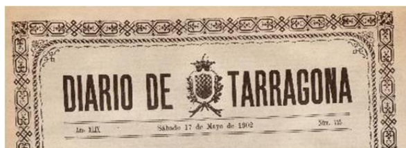
Fig. 7. Capçalera del Diario de Tarragona en la seva edició del període 1808-1932