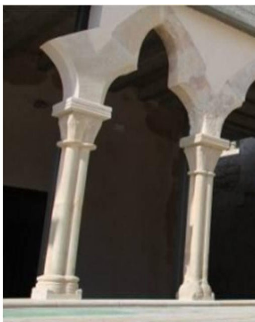
Fig. 1. Els capitells conservats del claustre de Sant Francesc

Efectivament, en la cantonada més propera a la porta d'accés hi trobem cinc arcs complets sobre set columnes recuperades de les que en temps circumdaven el claustre. Uns arcs trilobats, sobre uns canons de quatre feixos i uns senzills capitells austerament decorats amb dues fulles allargades a cada cara. Senzills, però reconeixibles.