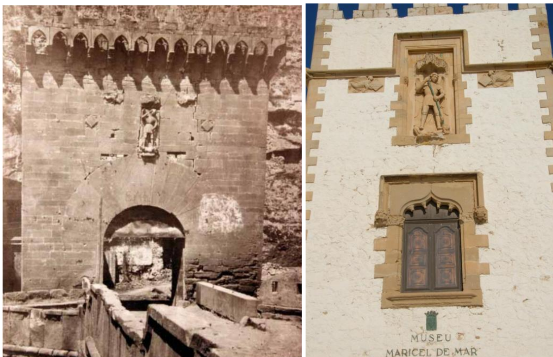
Fig. 6. Portal del pont de sant Miquel. Segle XIX. I la seva ubicació a la façana del Museu Maricel (actualment hi ha instal·lada una còpia atès el deteriorament de l'original).

balconada, provinent de Santa Coloma de Queralt, la figura del Sant Miquel que presidia el portal homònim a Balaguer o els portals de Palau Villena de Cadalso de los Vidrios de Madrid i del Palau de Raixa de Mallorca.