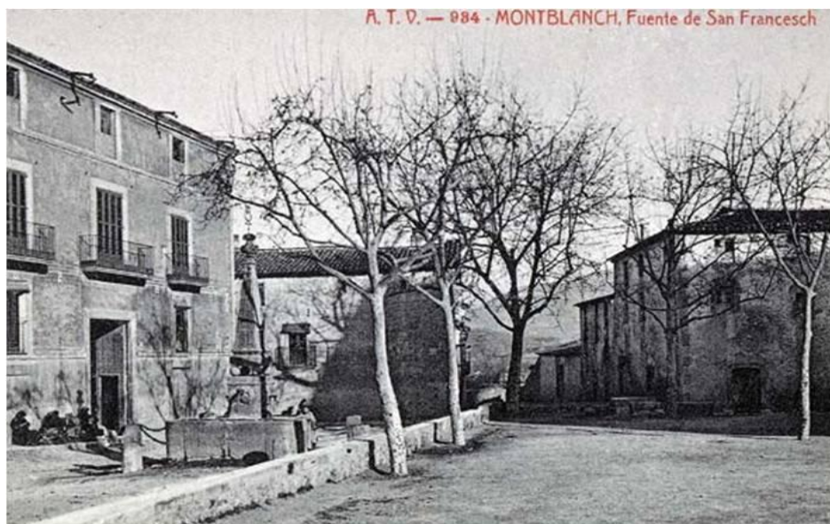
Fig. 3. Aspecte de la plaça de Sant Francesc abans de la reforma de 1927.

A l'instantània descobrim que tant la columna com el capitell són idèntics als que encara es conserven a Sant Francesc. Observant acuradament veiem que el canó està format per dues columnes i mitja per a fer la construcció més esvelta. No sabem què se'n féu de les restes un cop derruïdes. Malgrat l'afirmació de l'article reproduït, però, no podem donar raó de l'origen de la creu: revisant nombroses fotografies de la plaça de Sant Francesc preses des de diferents angles i en diferents èpoques (des de 1880 fins 1927 en que fou reformada) no hem trobat cap imatge on s'hi veiés la creu. Potser és molt anterior i es guardava en alguna dependència religiosa (cal recordar que el principal impulsor del monument i dels actes de commemoració del desè aniversari de la Coronació Canònica fou Mossèn Josep Roselló i Sans, custodi de Santa Maria aquells anys iii ).