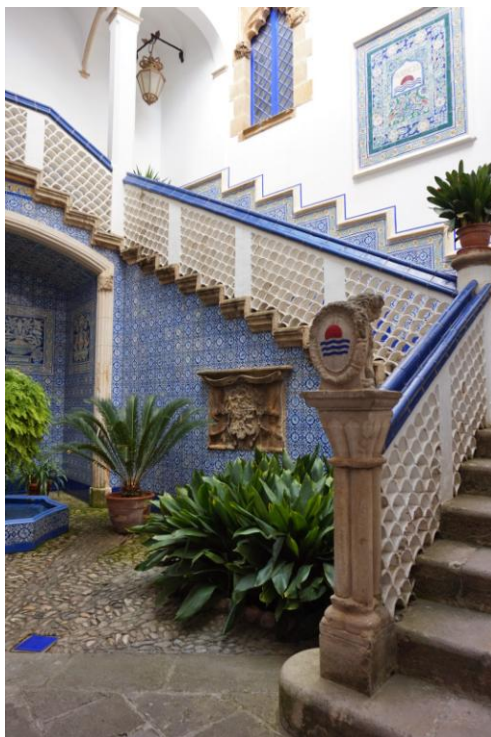
Fig. 4. L'escalinata a l'entrada del Palau Maricel

Confessem que, en una visita recent, no vam tenir cap vergonya en treure una cinta mètrica de la butxaca per confirmar que les mides són exactament iguals que les de Sant Francesc amb l'excepció de la columna que, òbviament, ha estat retallada per donar-li l'alçada adequada.